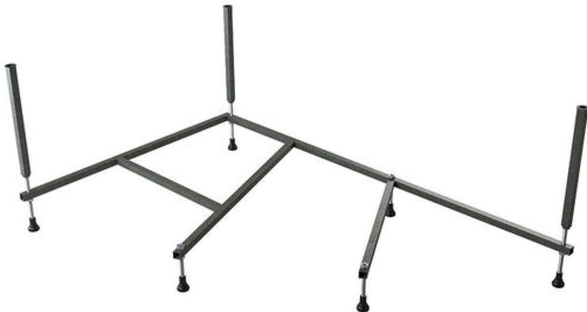
Рис.1: Схема сборки опорного каркаса